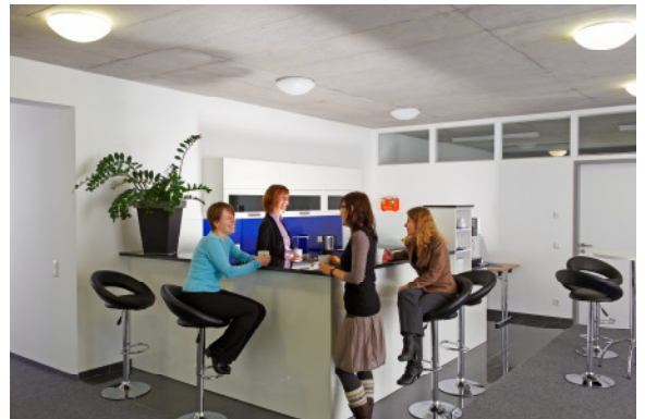
Vorraum des Seminarbereichs

Nach langer und intensiver Suche entschied sich das Unternehmen für einen Standort in Tübingen mit Nähe zum Universitätsklinikum.