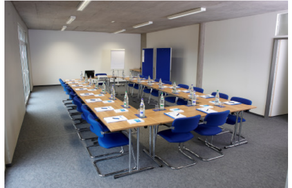
Attraktiver, erweiterbarer Seminarraum

Tübingen war das Raumangebot rasch erschöpft. Die CenTrial GmbH eröffnete weitere kleine Außenstandorte und verstreute sich über Tübingen. Im Laufe der Jahre waren die Büroarbeitsplätze und die Veranstaltungsräume auf vier verschiedene Adressen verteilt. Hinzu kam noch ab 2006 der zweite Standort in Ulm.